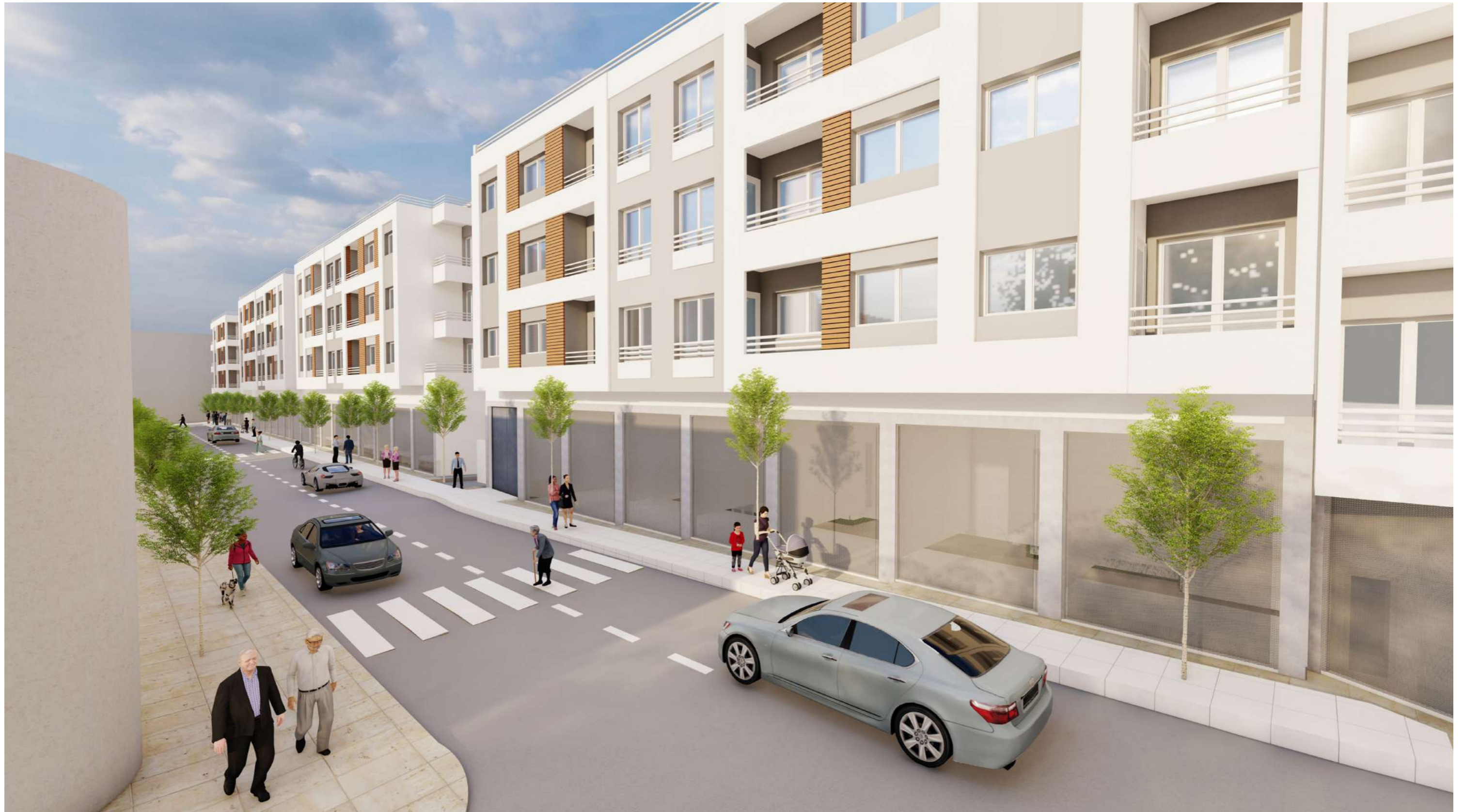
8IMAGE DE SYNTHESE 10 :VUE D'AMBIANCE EXTERIEUR