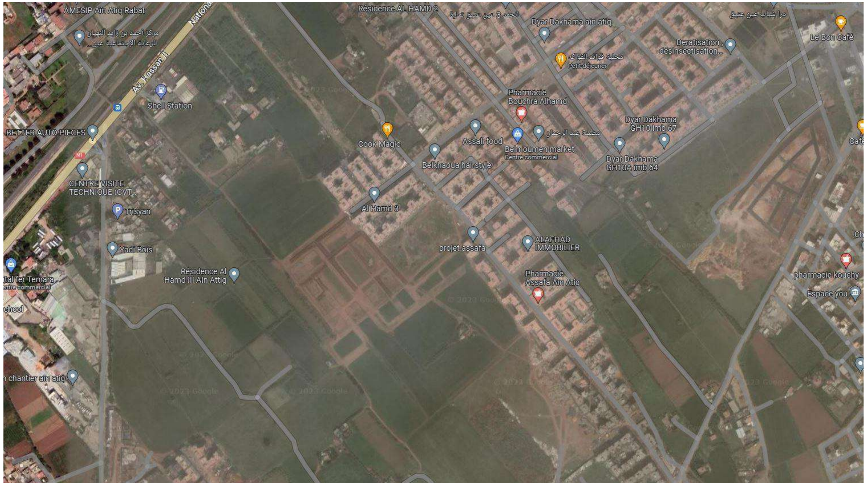
SITUATION SUR IMAGE SATELLITAIRE