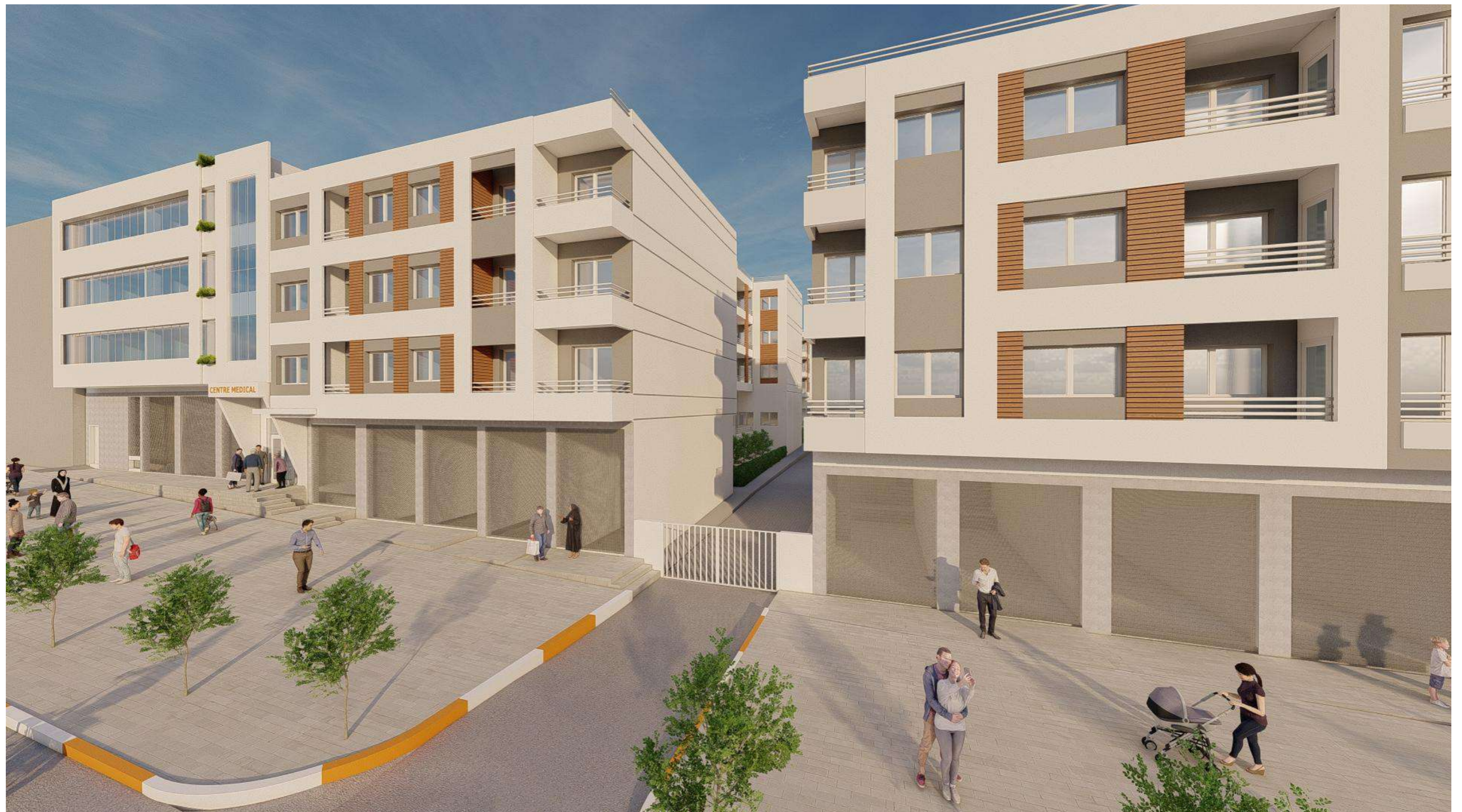
8IMAGE DE SYNTHESE 11 :VUE D'AMBIANCE EXTERIEUR